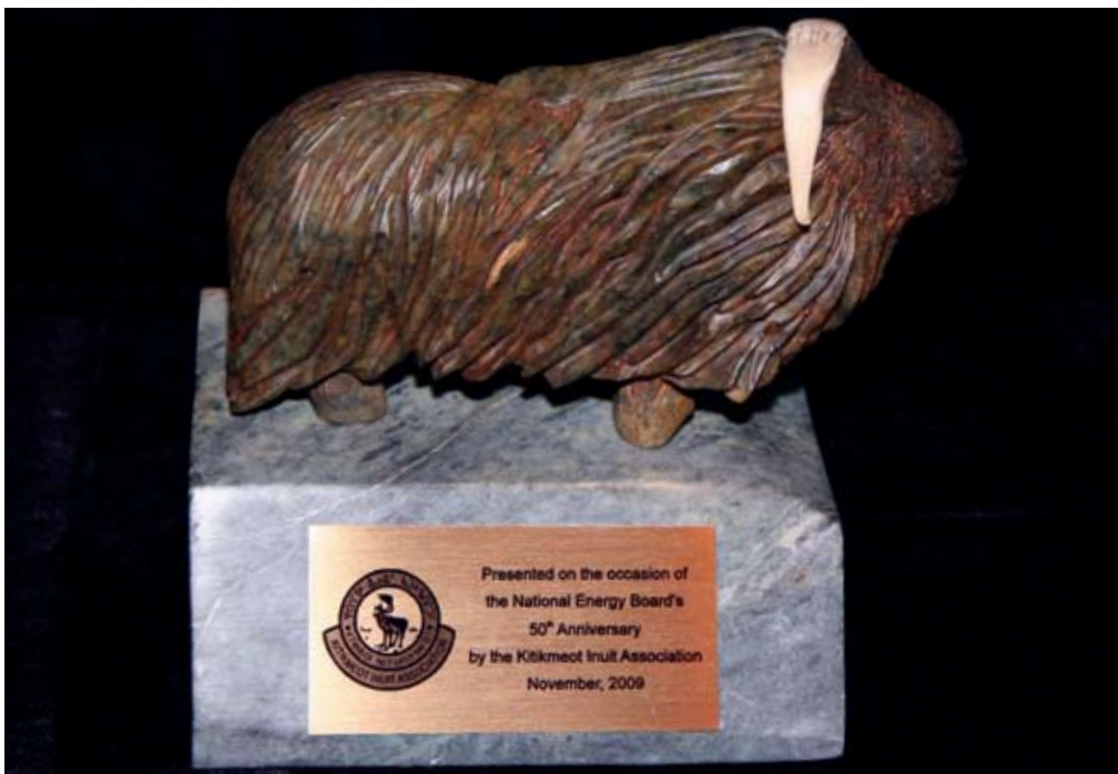
Musk Ox Sculpture presented to NEB by Kitikmeot Inuit Association. La sculpture de bœuf musqué offerte à l'ONÉ par l'Association inuite de Kitikmeot.